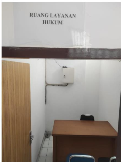
Ruang layanan hukum